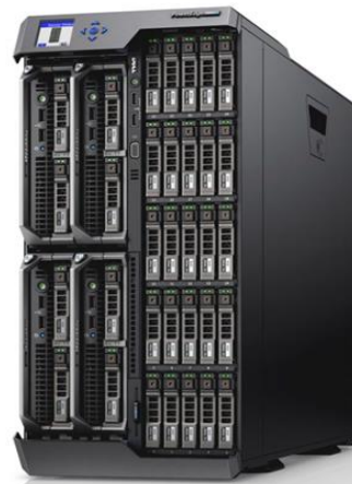
PowerEdge VRTX Semplice, efficiente e versatile